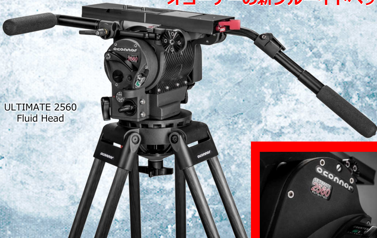
ULTIMATE 2560 Fluid Head

軽量デジタルシネマカメラとの ベストマッチングを実現する オコーナーの新フルードヘッド